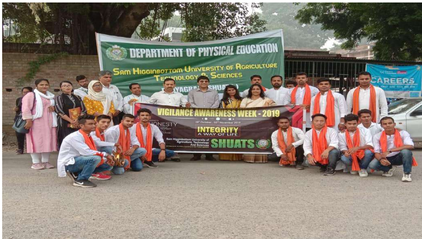
Organizers with the Participants