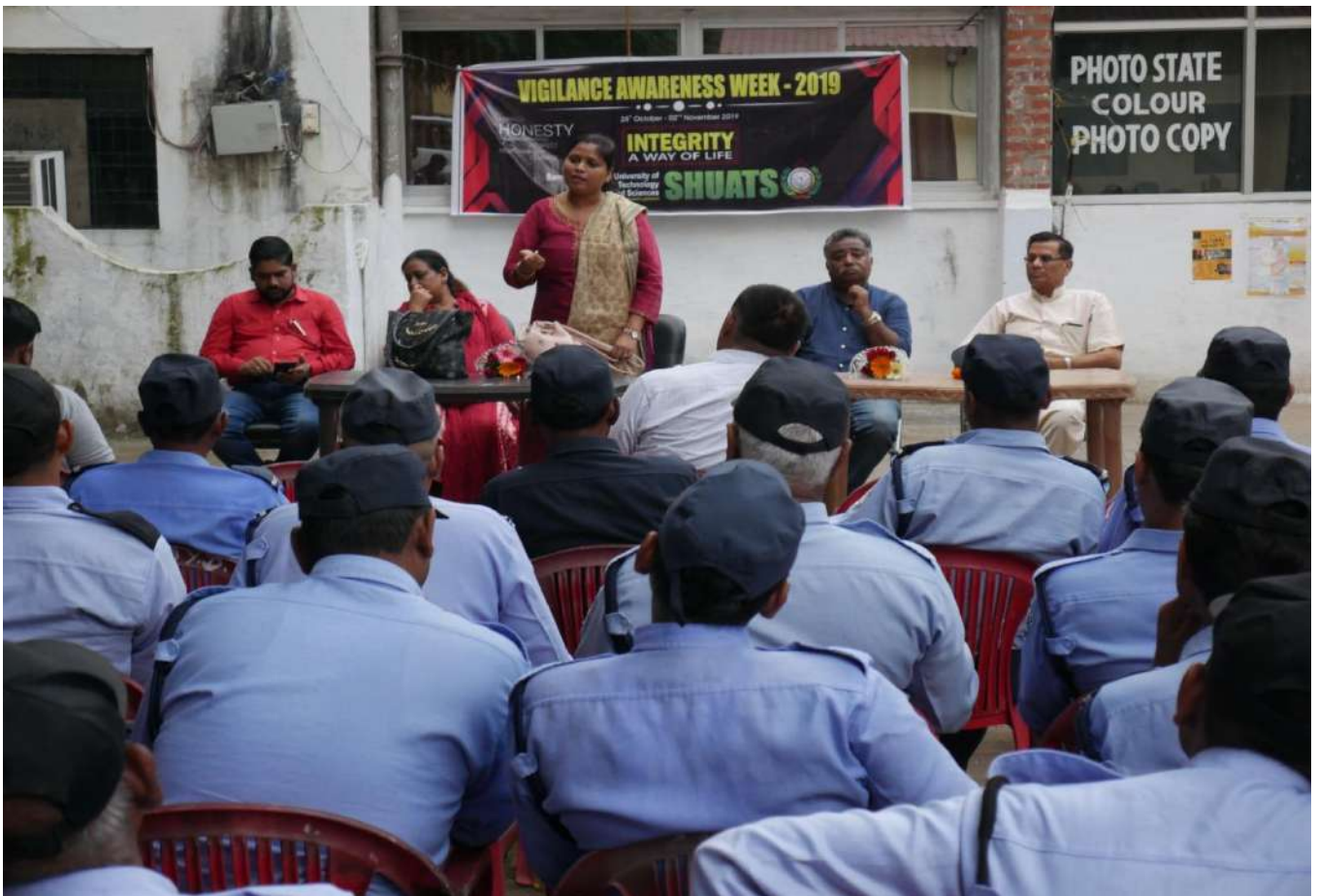
Motivated Speech by the Chief Guest