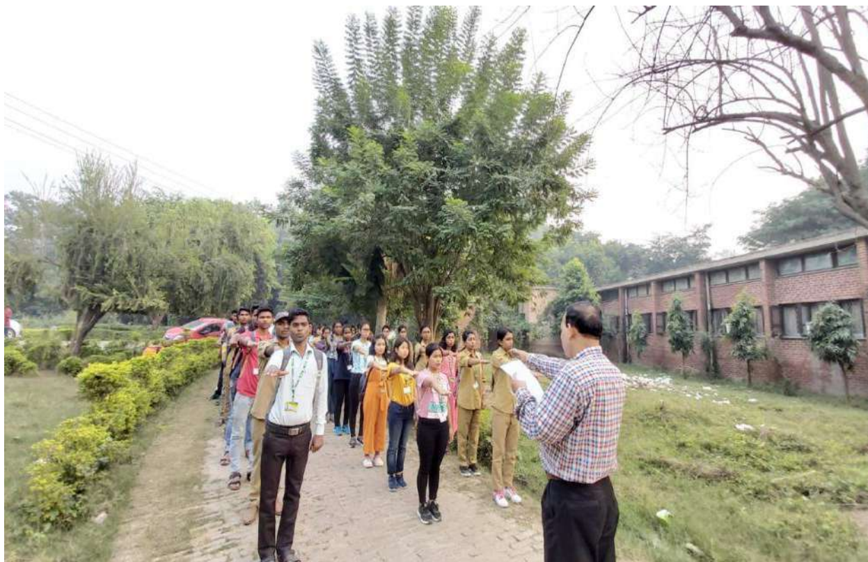
Integrity Pledge by NSS