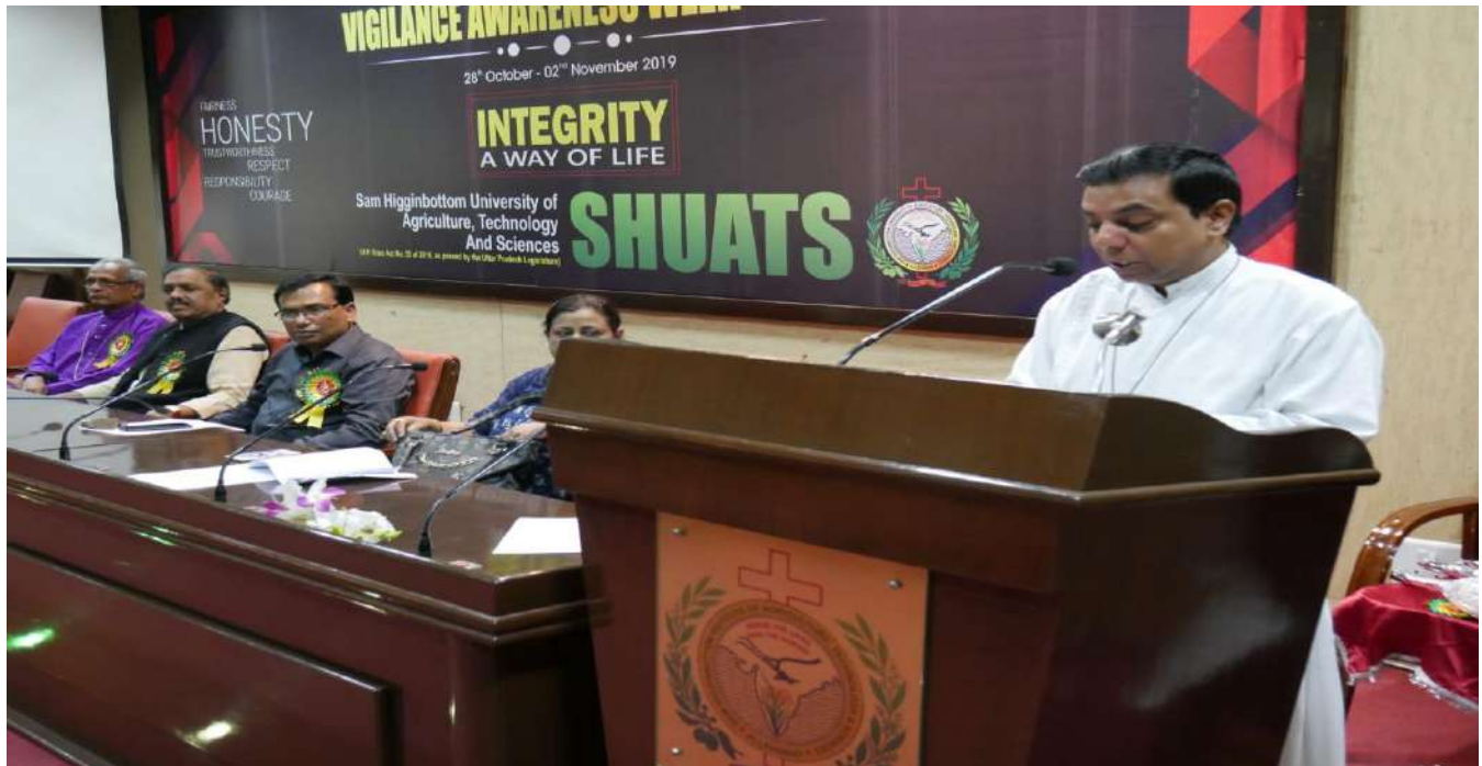
Welcoming Address by Dr. Rev.,Richmond