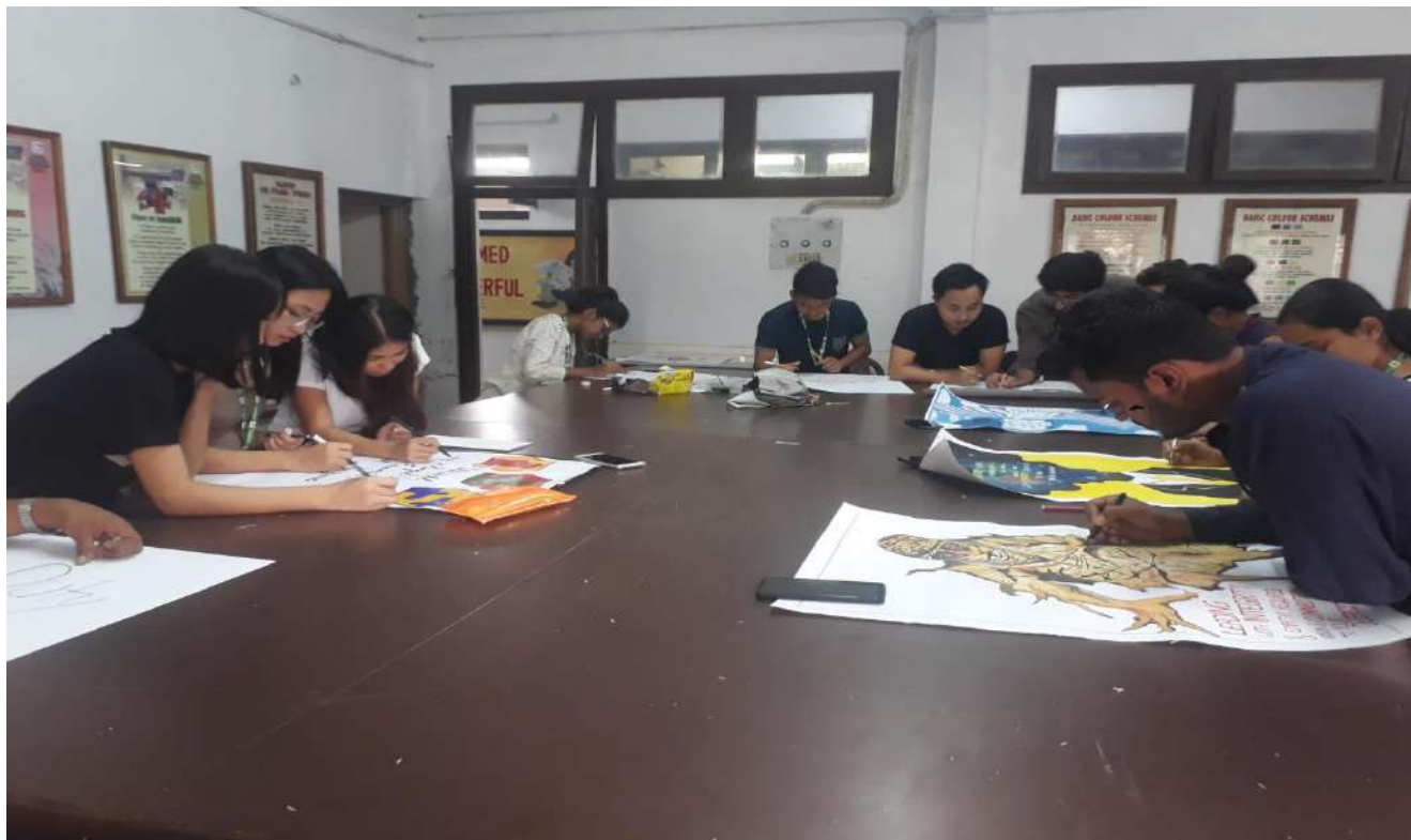
Participants of the Poster and Slogan Competition