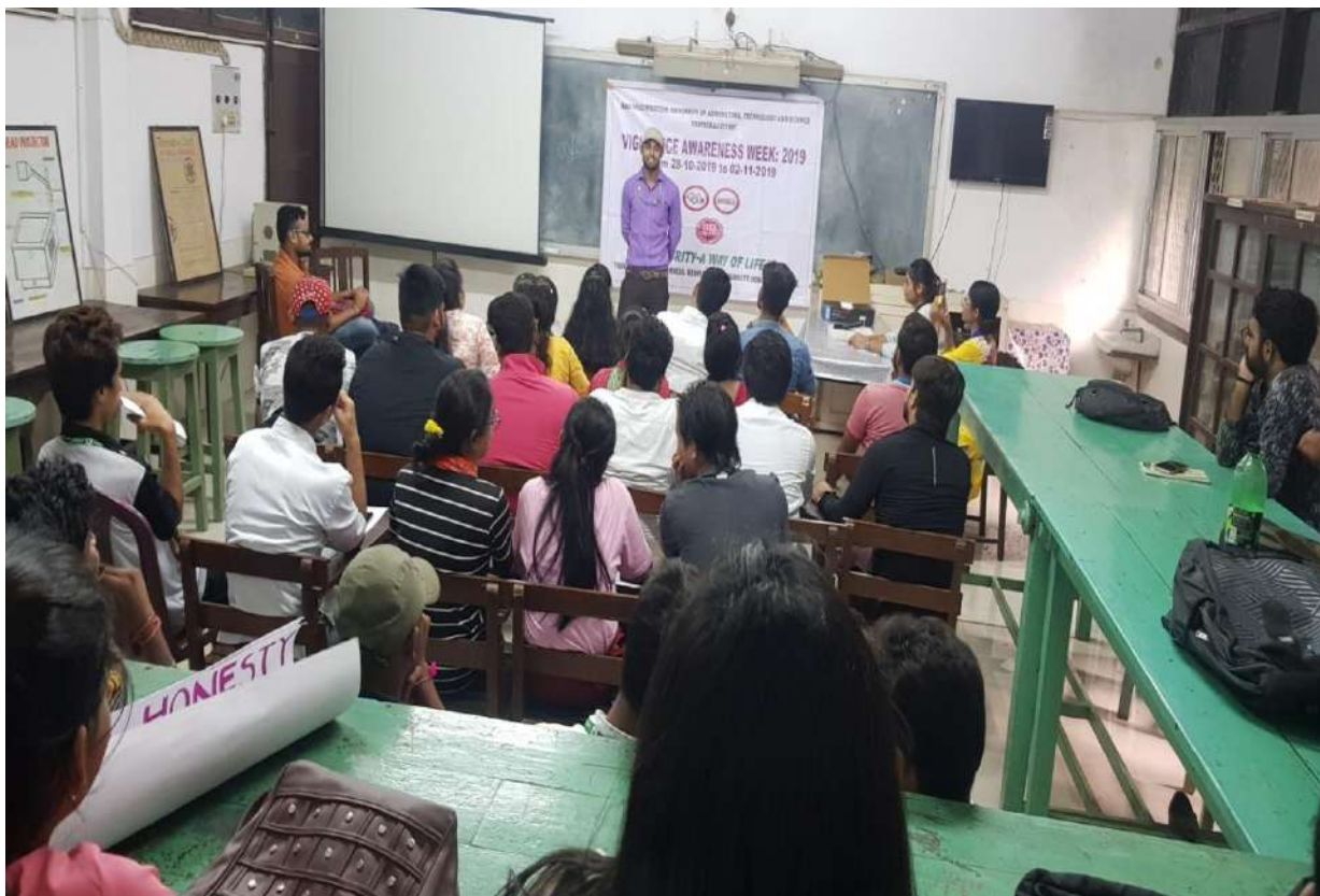
Debate competition in the Department of Agricultural Extension & Communication