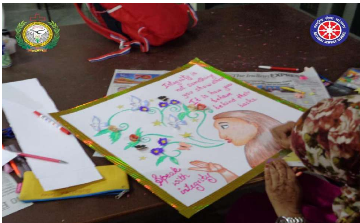
Poster Competition for the NSS Students