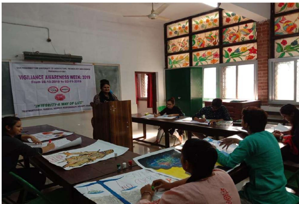
Department of Anthropology and Social Work Poster Competition.