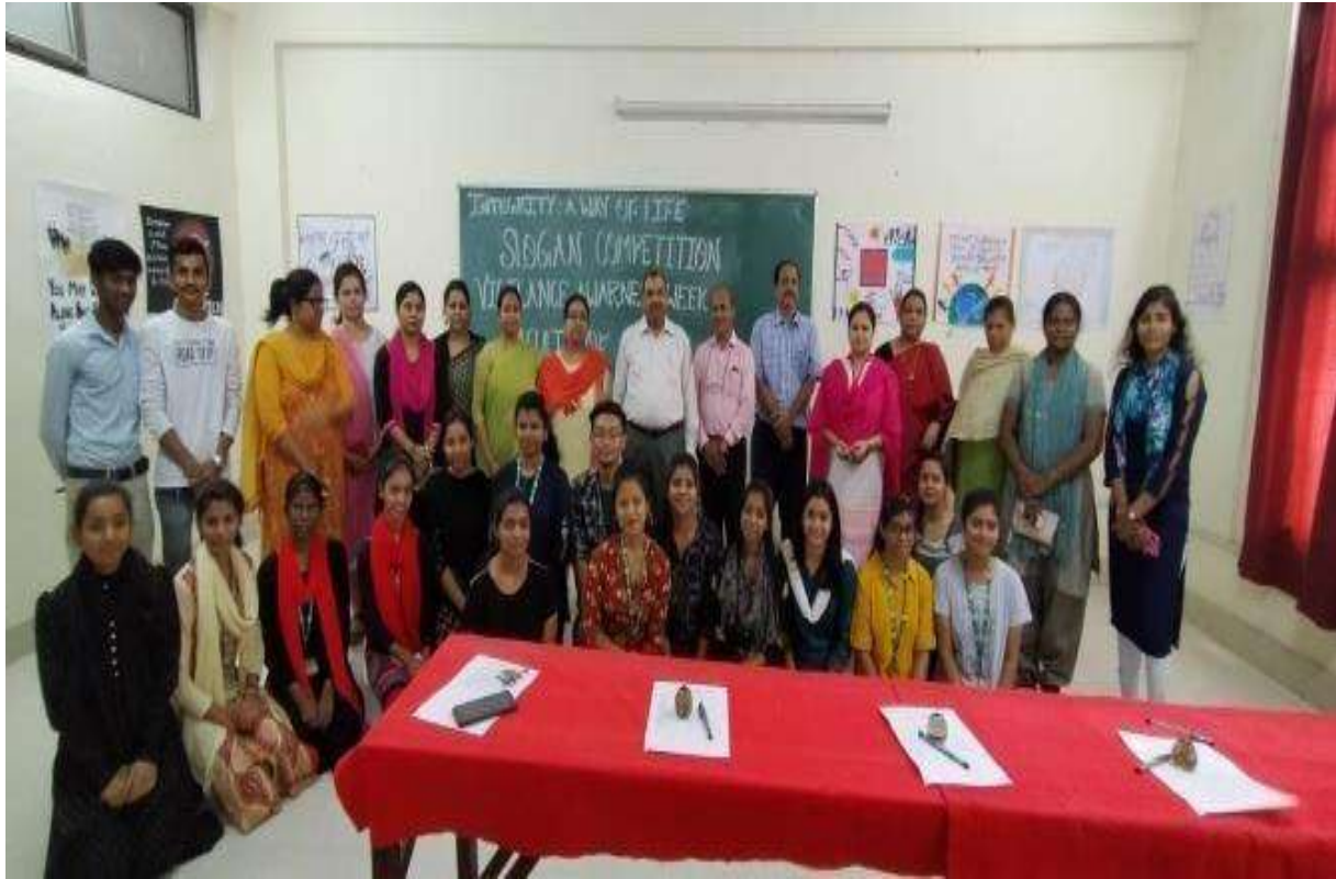
Faculty members of Health Science with the Participants of the Slogan Competition.