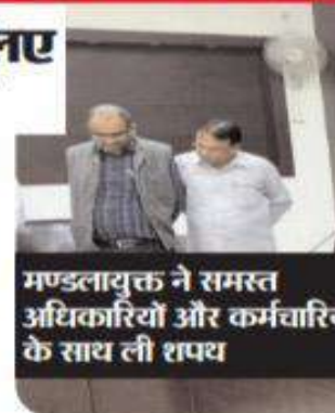
मण्डलायुक्त ने समस्त अधिकारियों और कर्मचारियों के साथ ली शपथ

संलग्न रहना चाहिए साथ ही देश की सुरक्षा व सम्पन्नता के प्रति स्वयं को समर्पित करने की भावना के साथ ही यह संदेश देशवासियों को बीबी फैलाने का परवक प्रयास करना चाहिए। देश की एकता की भावना का संरक्षण देशवासियों में करके ही इस सरदार लक्ष्म भाई पटेल के लिए अपनी खाली अग्रद्वारा समर्पित कर सकते हैं। सरदार लक्ष्म भाई पटेल की दूरदर्शिता के द्वारा राष्ट्रीय एकता की भावना का संरक्षण देशवासियों के हृदय में प्रबल बनाया जा सकता। इस समारोह में मण्डलावलोक ने सभी को देश की आंतरिक सुरक्षा सुनिश्चित करने के लिए सर्वप्रजा के साथ अपना धन्यपूर्ण योगदान करने का संकल्प लेने के लिए प्रेरित किया।