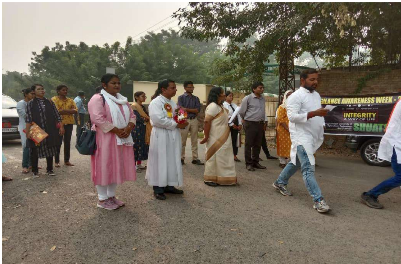
Section of the Audience