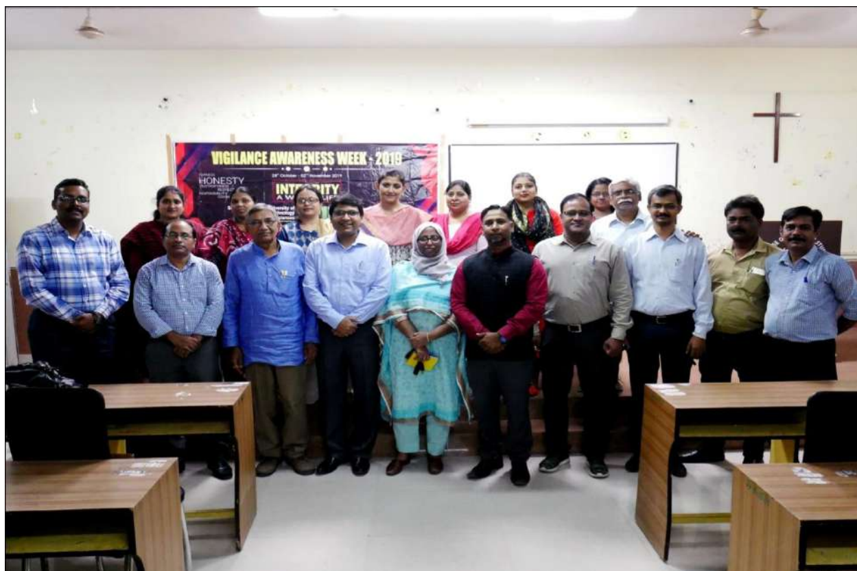
Group Photo of the Faculty members.