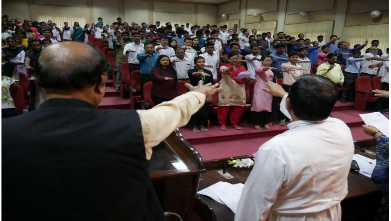
Integrity Pledge Taken By All the Employees and Students of SHUATS