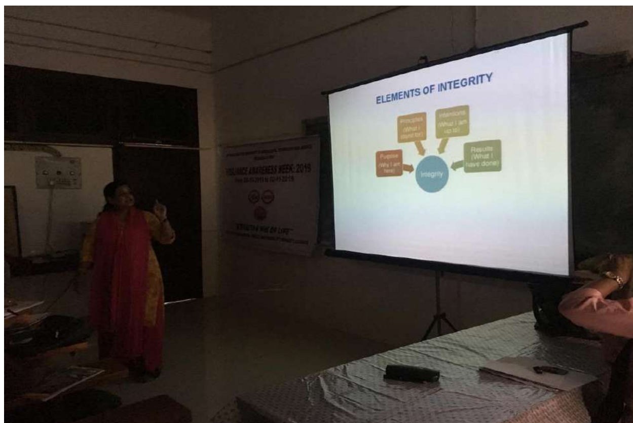
Prof.Dr. Jahanara delivering a Lecture about Integrity at the closing ceremony of the Vigilance Awareness Week, 2019