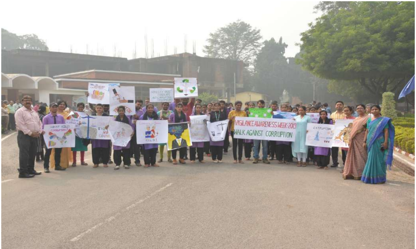
Faculty Members and Students Holding Placard, Poster and Banner