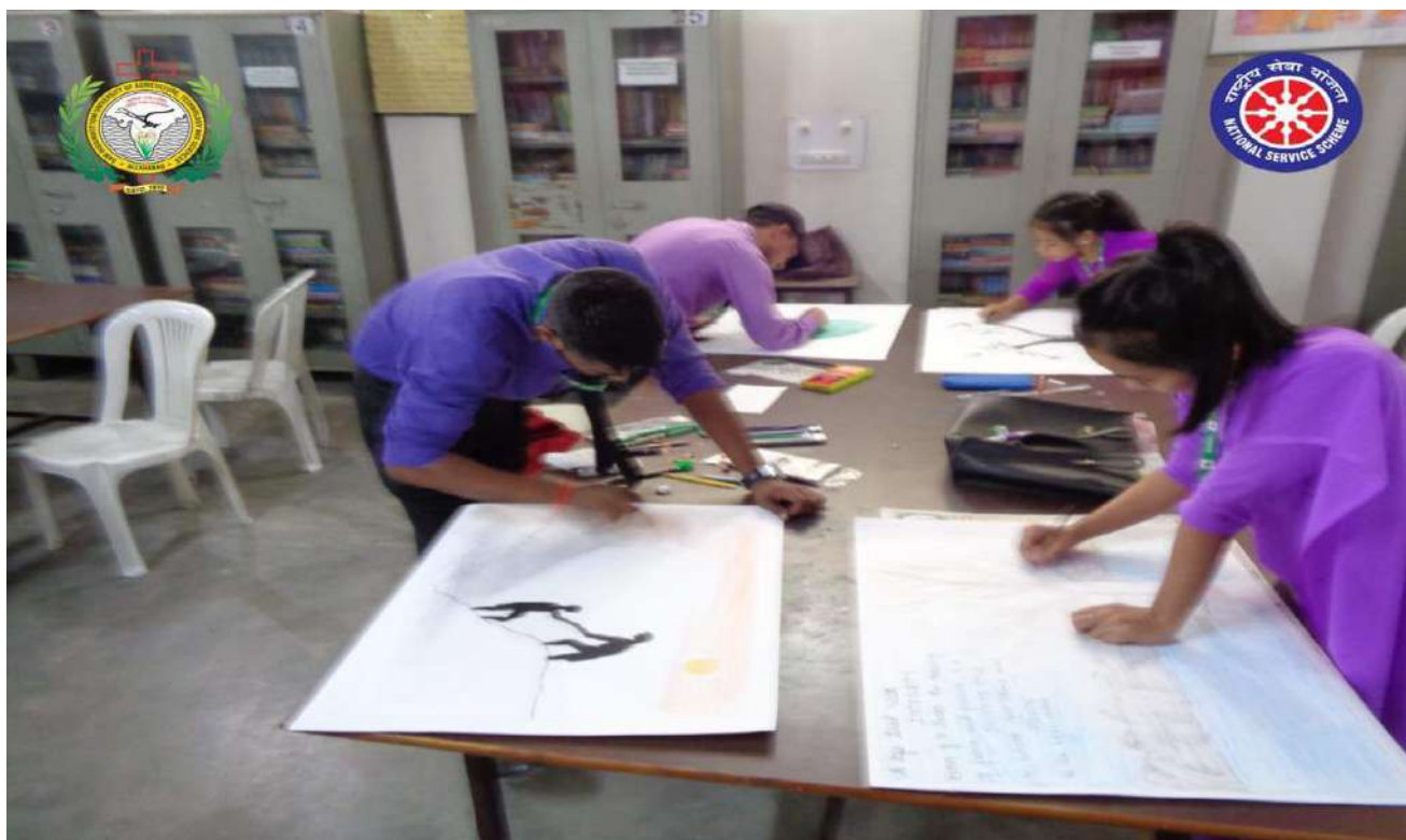
Participants of the Competition