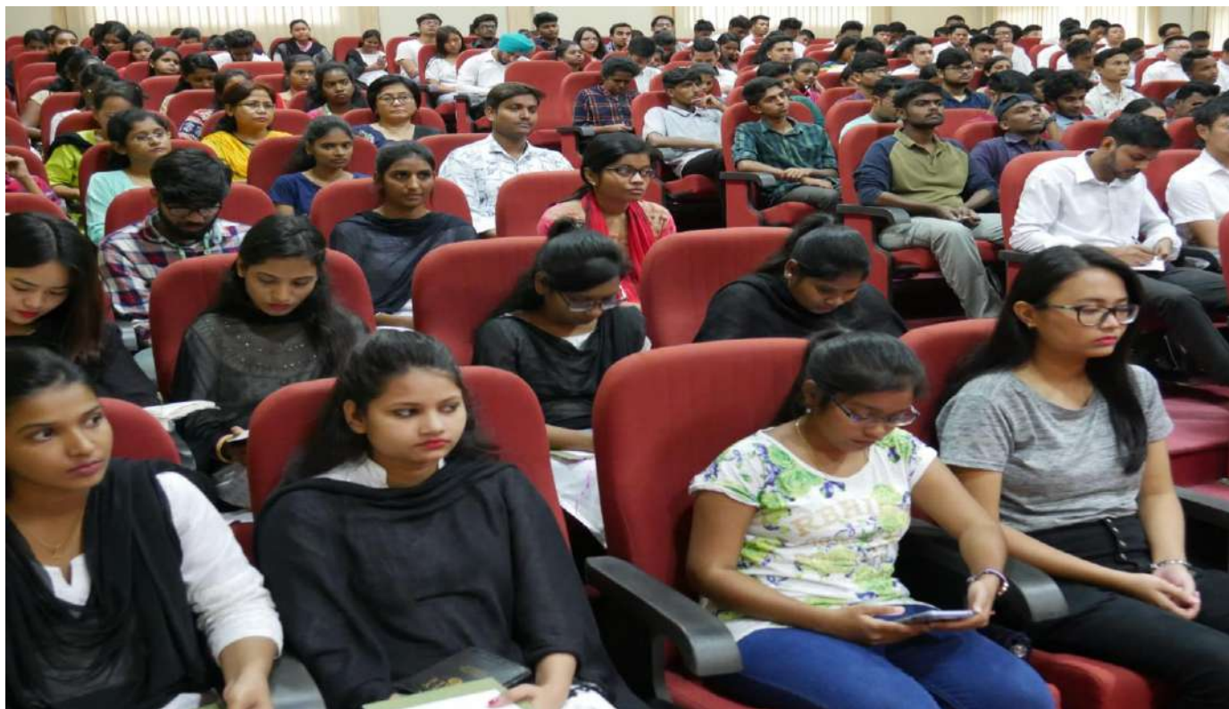
Audience present during the Program