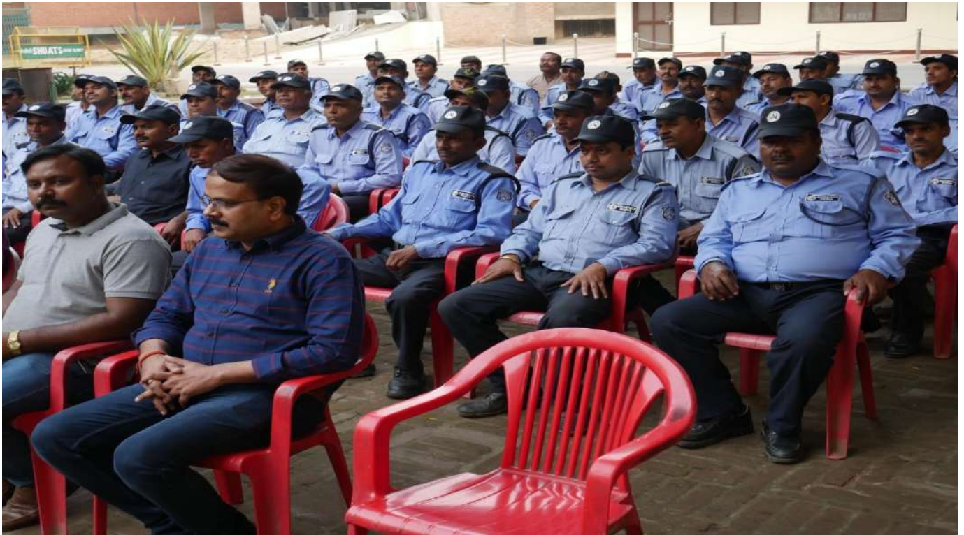
Photo of the Gaurds Attenting the Program