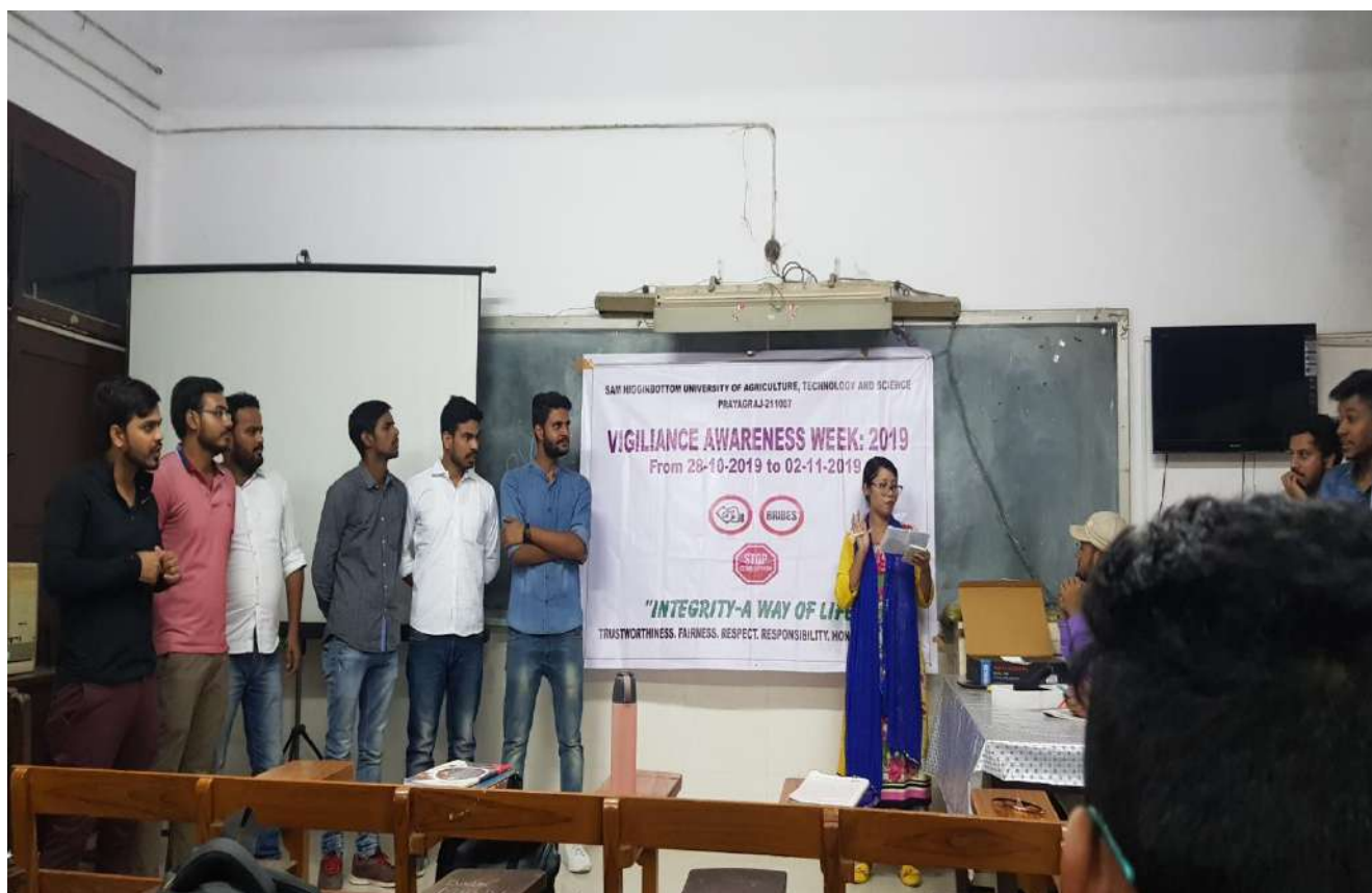
Quiz Competition in the Department of Agricultural Extension and Communication