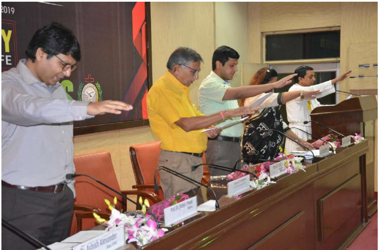
Integrity Pledge Taken By All the Employees and Students of SHUATS