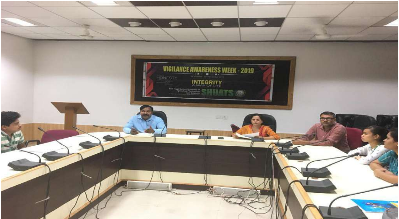
Organizers with the Participants