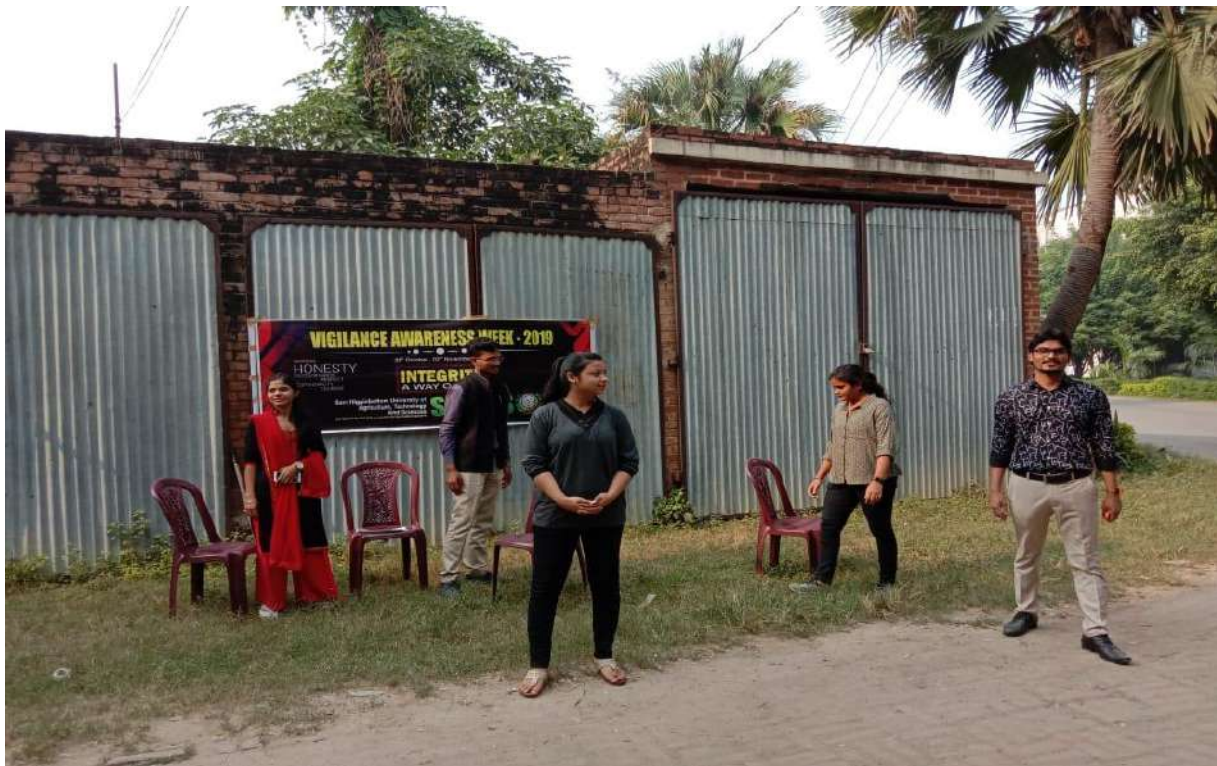
Nukkad Natak(Street Play) by the students of Anthropology & Social-work emphasizing to fight against corruption and maintain Integrity.