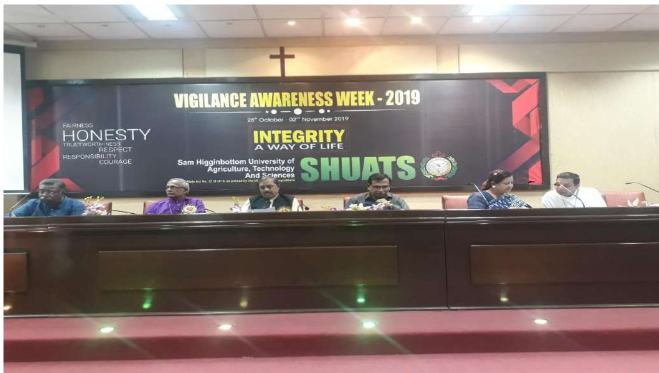
Chief Guest with the Dignitaries on the dais