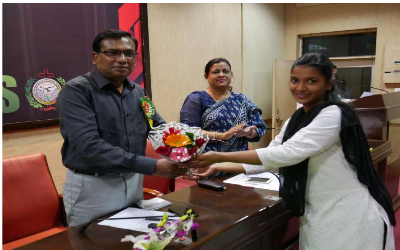
Welcoming the Pro-VC Academics in the Inaugural Session