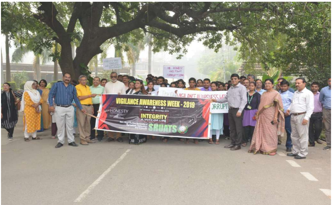
Walkathon by the Students and Staffs of SHUATS.