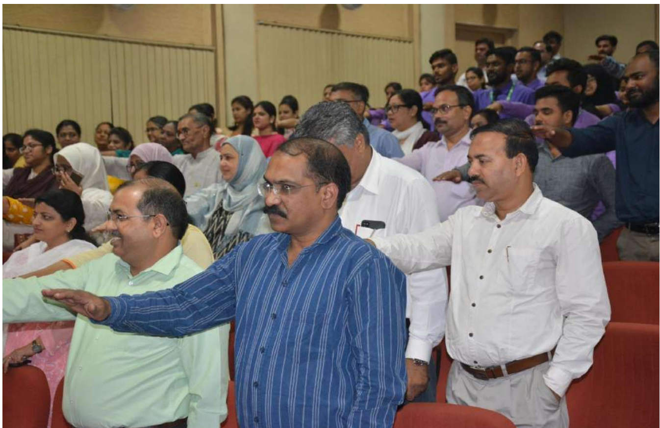
Mass Integrity Pledge