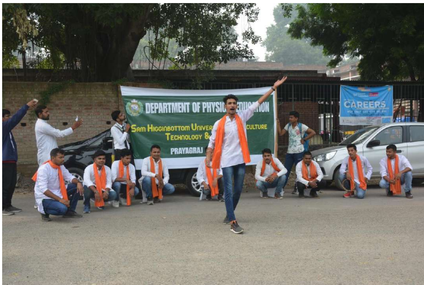
Street Play by the students of Physical Education, SHUATS